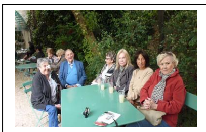
Petit repos tranquille dans

Nous serons donc moins nombreux pour les sorties, mais nous espérons être au complet lors de notre repas d'été qui aura lieu comme les autres années fin juin.