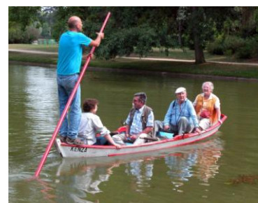
Sortie au lac Daumesnil le 10 mai.

Il n'y aura pas de journal en juillet ni en août, le prochain sera donc envoyé fin août pour les sorties de septembre. Pensez, malgré les vacances, à en préparer quelques unes pour l'automne.